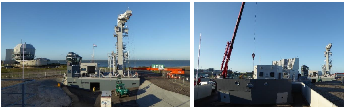
De Zeemanschapstrainer eind november 2017, het dek ligt verzonken in het landschap

De Zeemanschapstrainer voor de Koninklijke Marine op Harssenseiland is gereed, op een paar laatste afwerkingen na. De trainer staat prachtig in het landschap en is een verrijking voor de marinehaven. Het dek van de Karel Doorman is nagebouwd en zal in 2018 in gebruik worden genomen voor de trainingsdoeleinden van de Marine. Het is een echte aanwinst voor Den Helder.