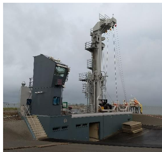
De Zeemanschapstrainer begin december, het project gaat prachtig op in de nautische omgeving