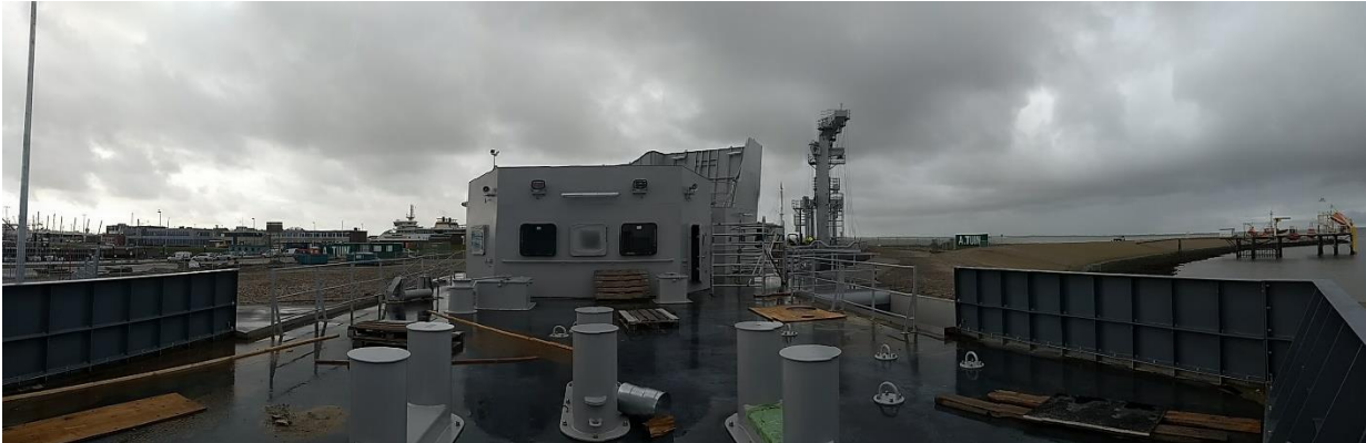
De Zeemanschapstrainer begin december. Aan stuurboord kijk je direct uit over de Waddenzee wat het gevoel versterkt op een echte boot te staan.